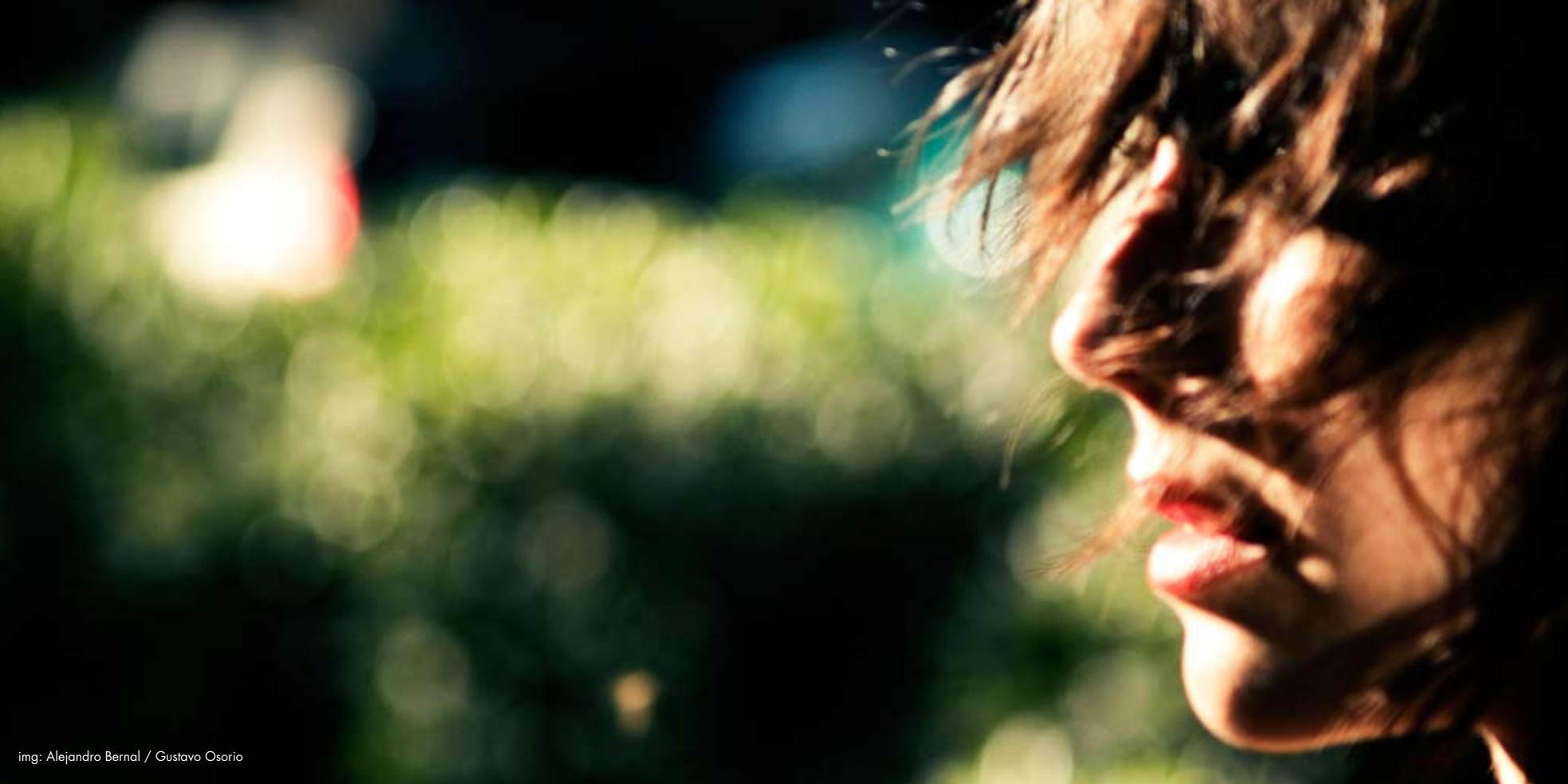
img: Alejandro Bernal / Gustavo Osorio